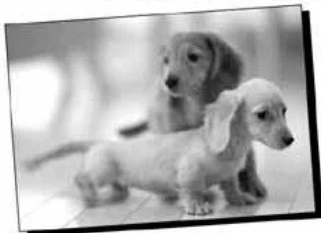
〈建築一部(木造) 高野〉