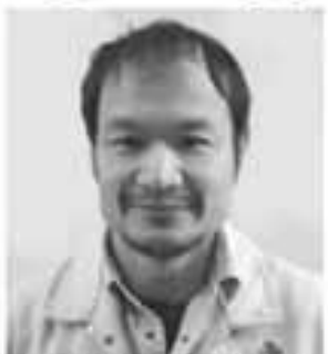
〈建築二部(特建) 原山〉