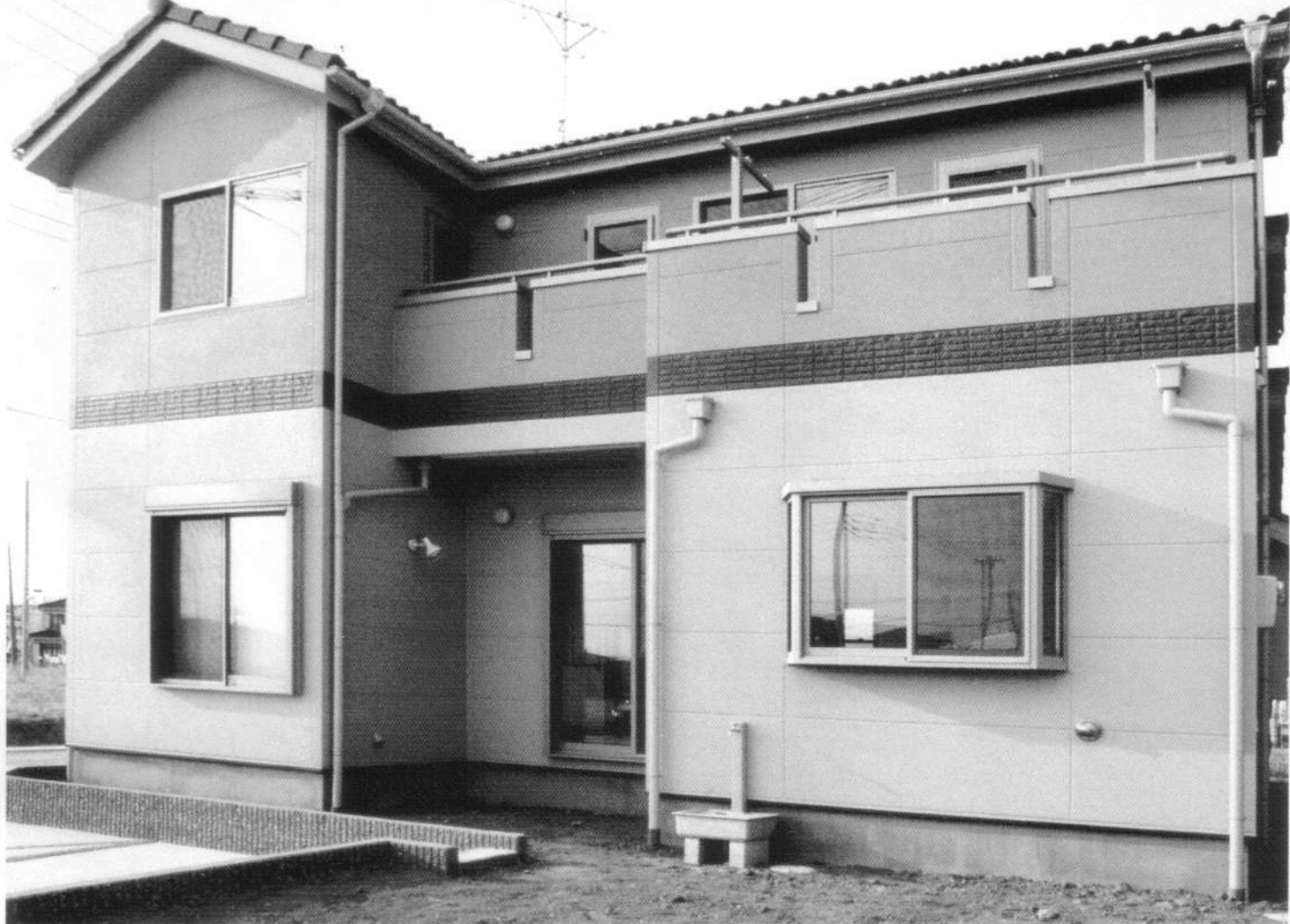
A様邸 (吉川中央土地区画整理地)